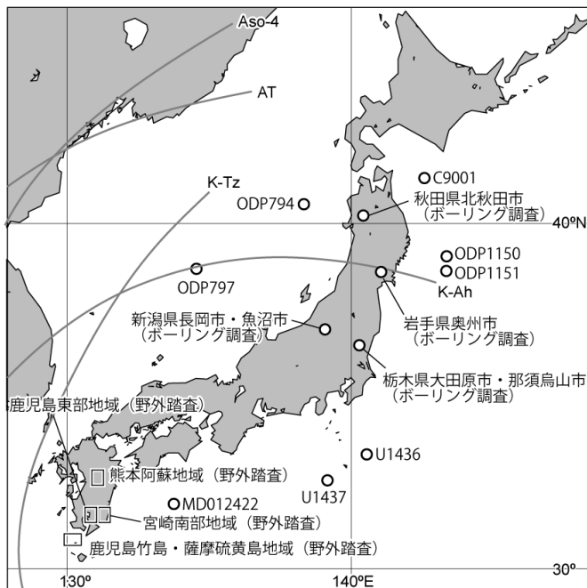
図1 調査地域及び本業務に関連した海底コアサイトの位置図。K-Ah、AT、Aso-4、K-Tz は九州の火山から噴出したテフラの分布を示し、日本列島全体に飛散している。