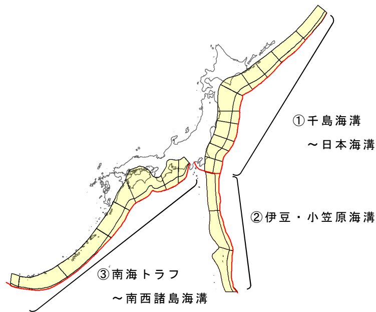
解説図 1 プレート間地震に起因する津波波源の対象領域

ただし、2011年東北地方太平洋沖地震では宮城県沖の日本海溝近傍においておよそ50mを超える大すべりが生じたばかりであり、今後数百年オーダーの期間にこの領域で同程度の規模のすべりの発生が起こる可能性は他の地区に比べて小さい。