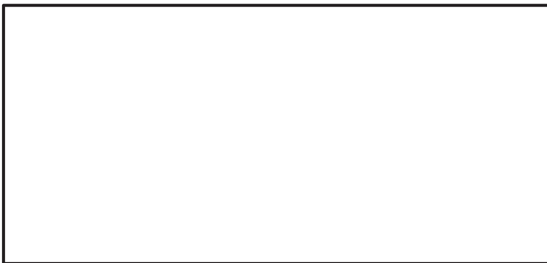
図 4-1 ジェットデフレクタの応力評価点