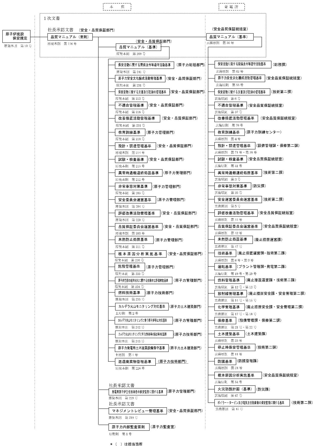
第1.17-1図 品質マネジメントシステム計画に係る規定文書体系図