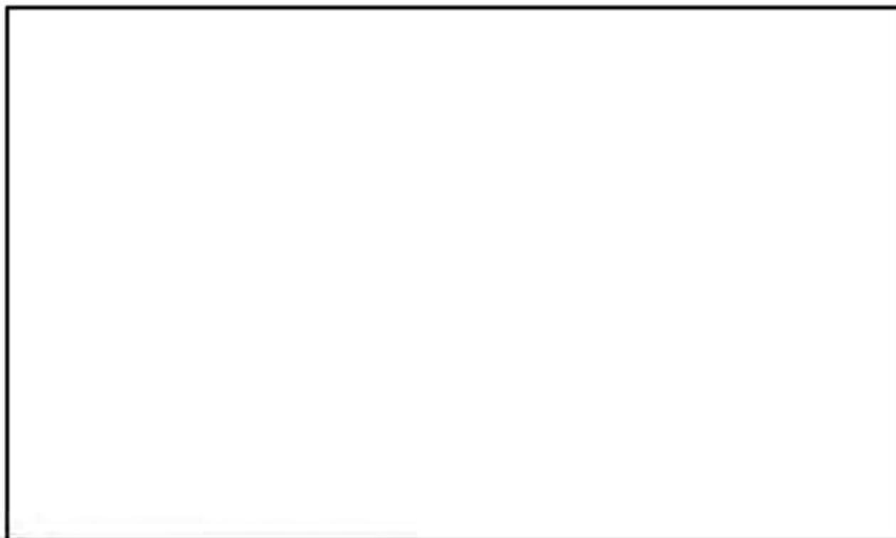
別紙 3-1 図 中性子遮蔽材の質量減損データ (註) (自社開発品 [MREX レジン] 及び NS-4-FR (1) )

前頁に示した中性子遮蔽材（エポキシ系樹脂）の質量減損率算定式 (1) の基となる質量減損データと MSF-24P 型の中性子遮蔽材（エポキシ系樹脂、自社開発品）の質量減損データを重ねたものを別紙 3-1 図に示す。図に示すとおり、両者の質量減損率は同等であり、文献の質量減損率算定式を用いることは妥当である。