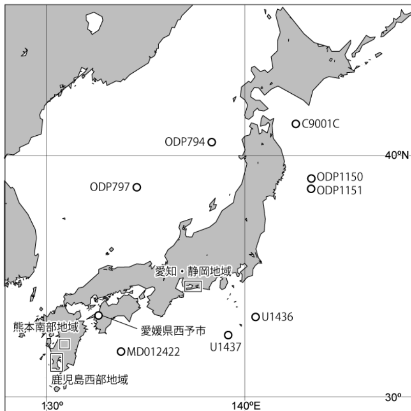
図1 調査地域及び本業務に関連した海底コア及び陸域コアの位置図