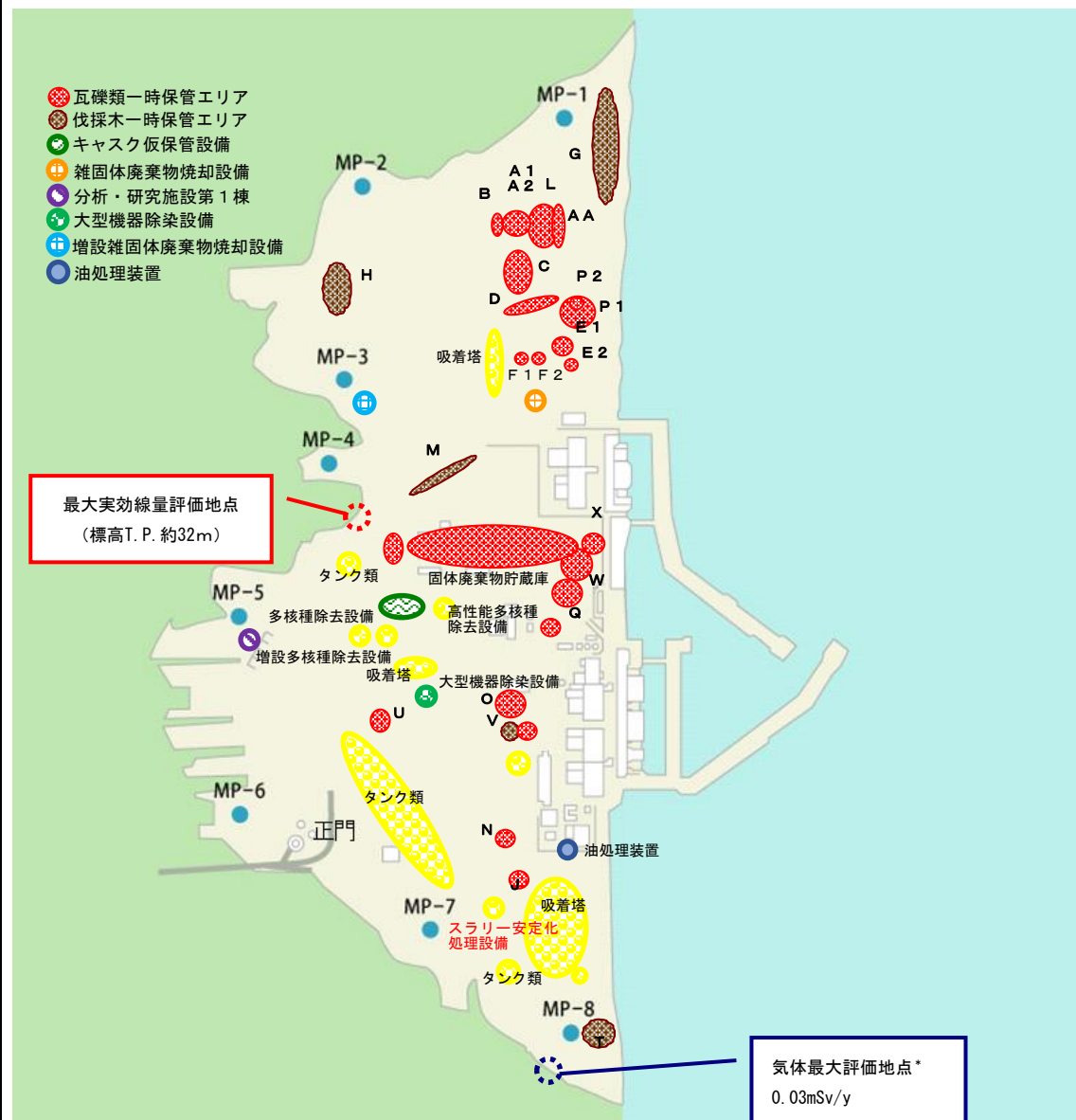
図 2. 2. 2-2 敷地境界線上の最大実効線量評価地点