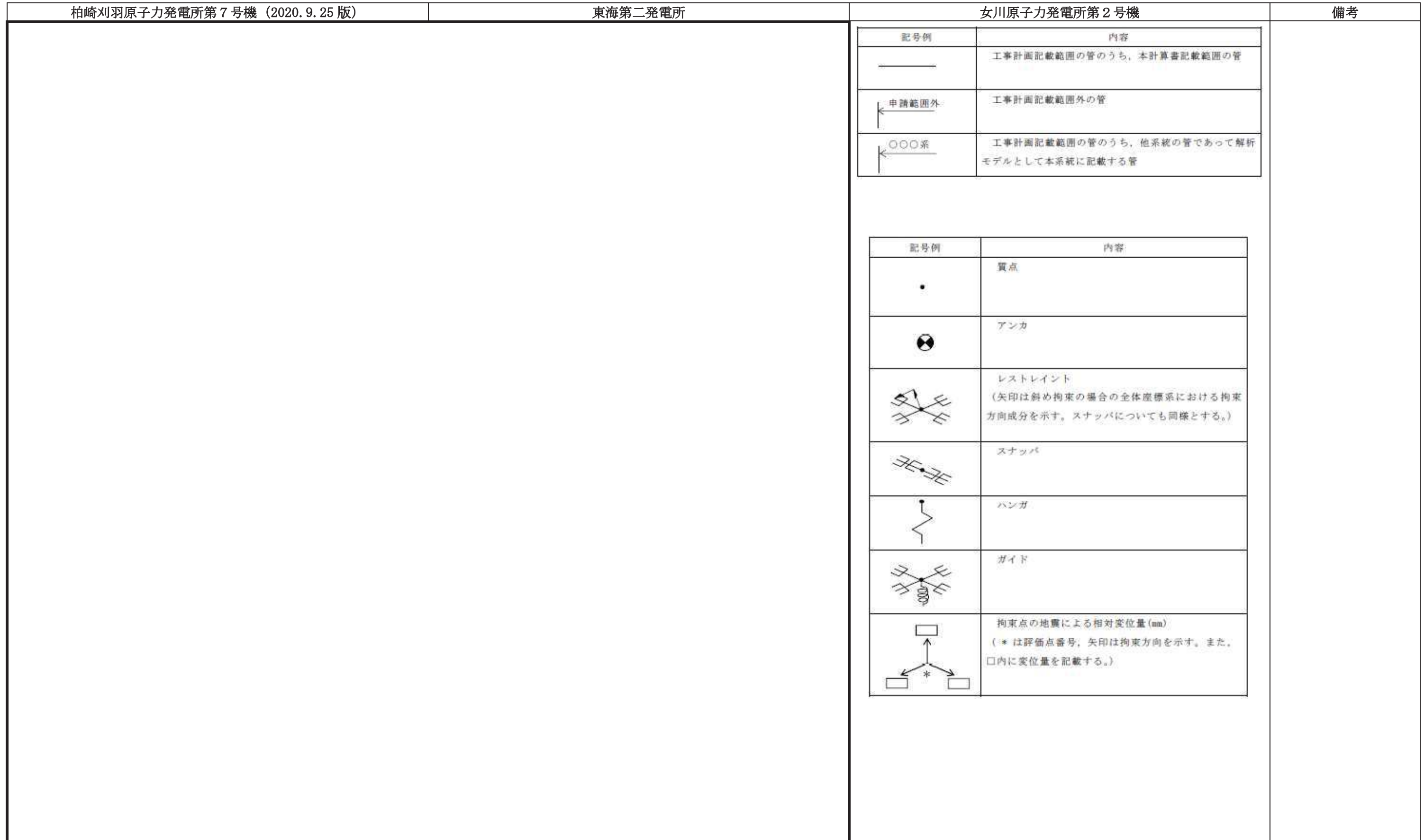
先行審査プラントの記載との比較表（VI-2-1-13-6_管の耐震性についての計算書作成の基本方針）

赤字：設備，運用又は体制の相違点（設計方針の相違） 緑字：記載表現，設備名称の相違（実質的な相違なし） ■：前回提出時からの変更箇所