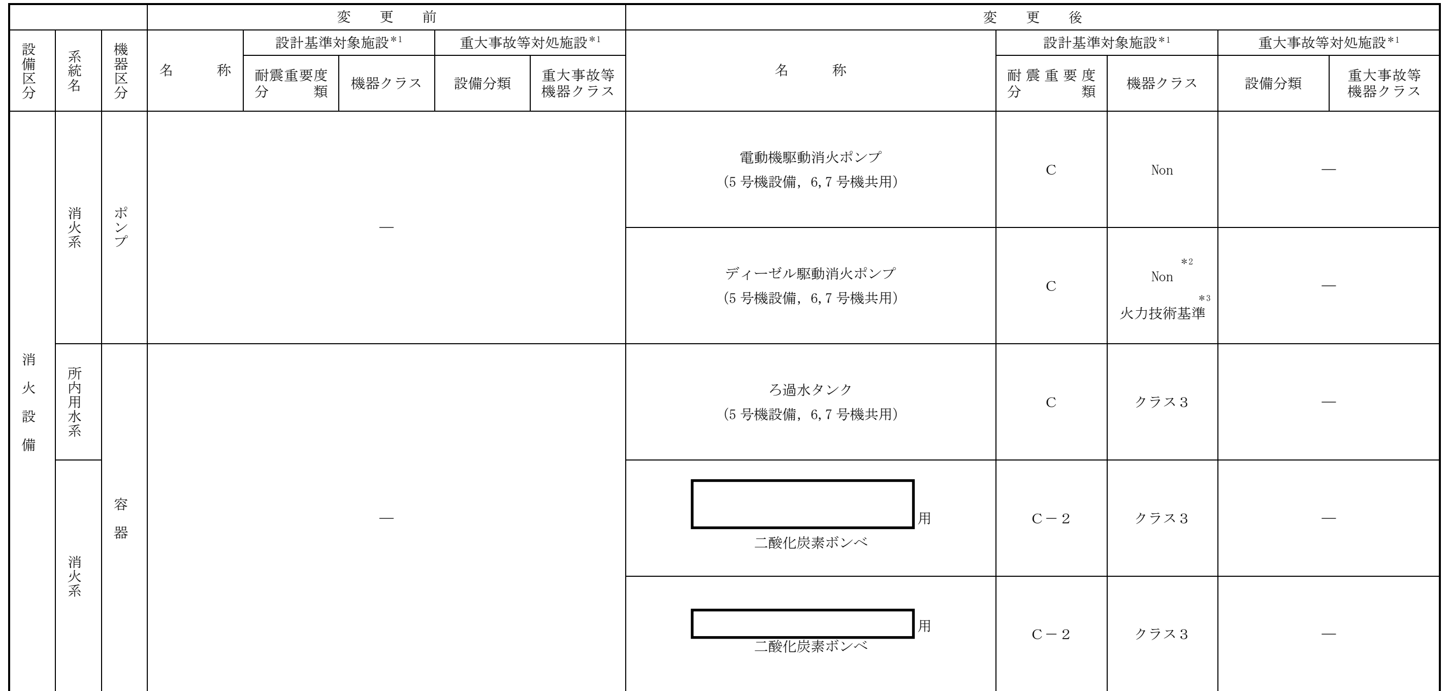
表1 火災防護設備の主要設備リスト (2/84)