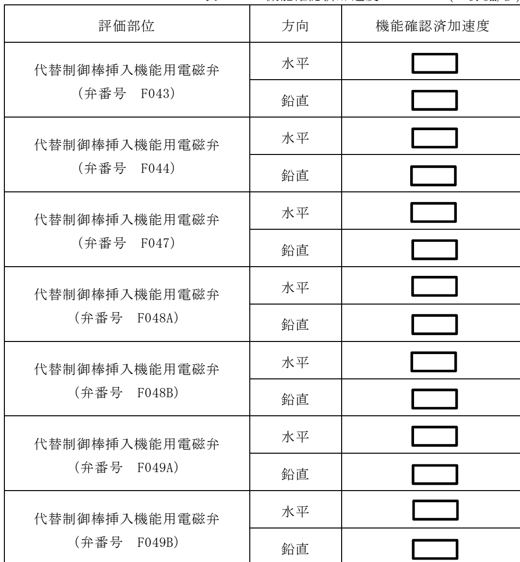
表 4-2 機能確認済加速度 (×9.8m/s 2 )