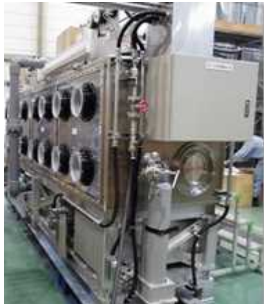
仕様; 幅約4m×奥約1m、高さ約1m(架台除く)