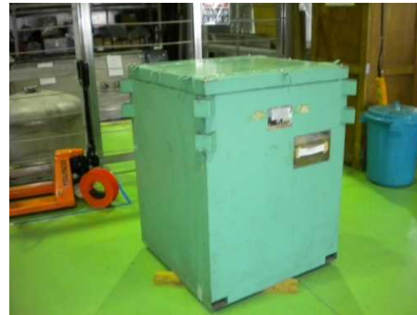
仕様; 一辺約1m、重さ約3t