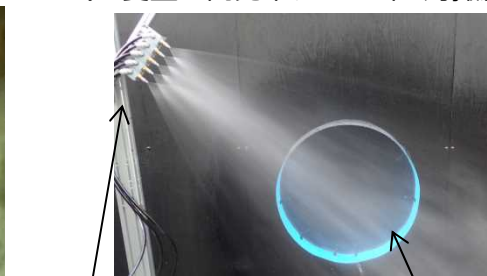
散水ノズル 模擬X-6ペネ