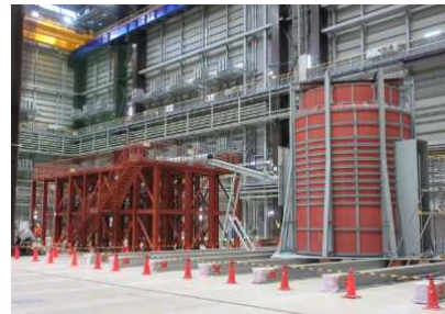
モックアップ(JAEA橋葉)