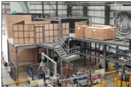
モックアップ(英国RACE)