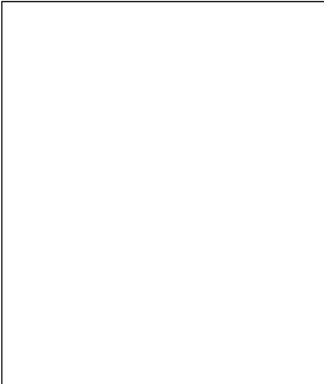
図3 スロッシングによる波高の影響