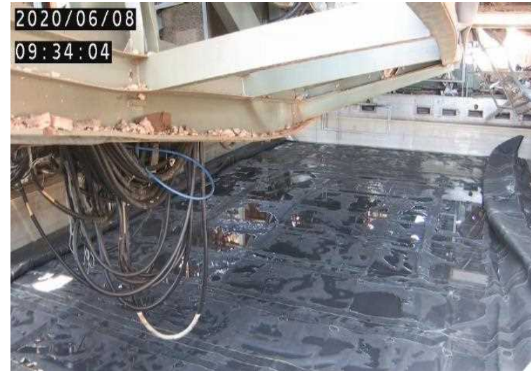
【SFP上で養生バック展張完了※】