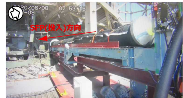
【オペフロ作業床に設置された養生バック及び養生バック投入装置※】