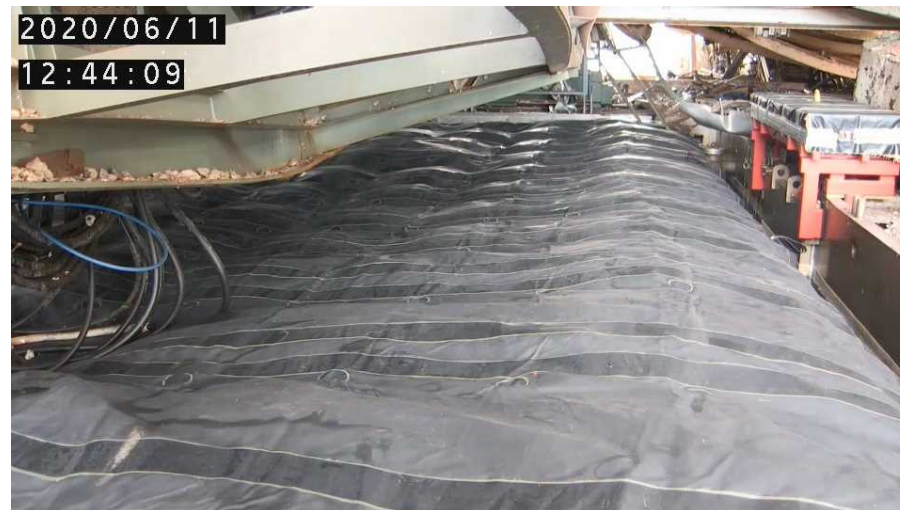
【養生バックへのエアモルタル充填が完了※】