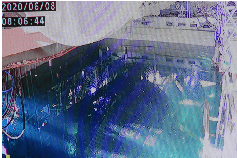
【養生バック投入前のSFP※】