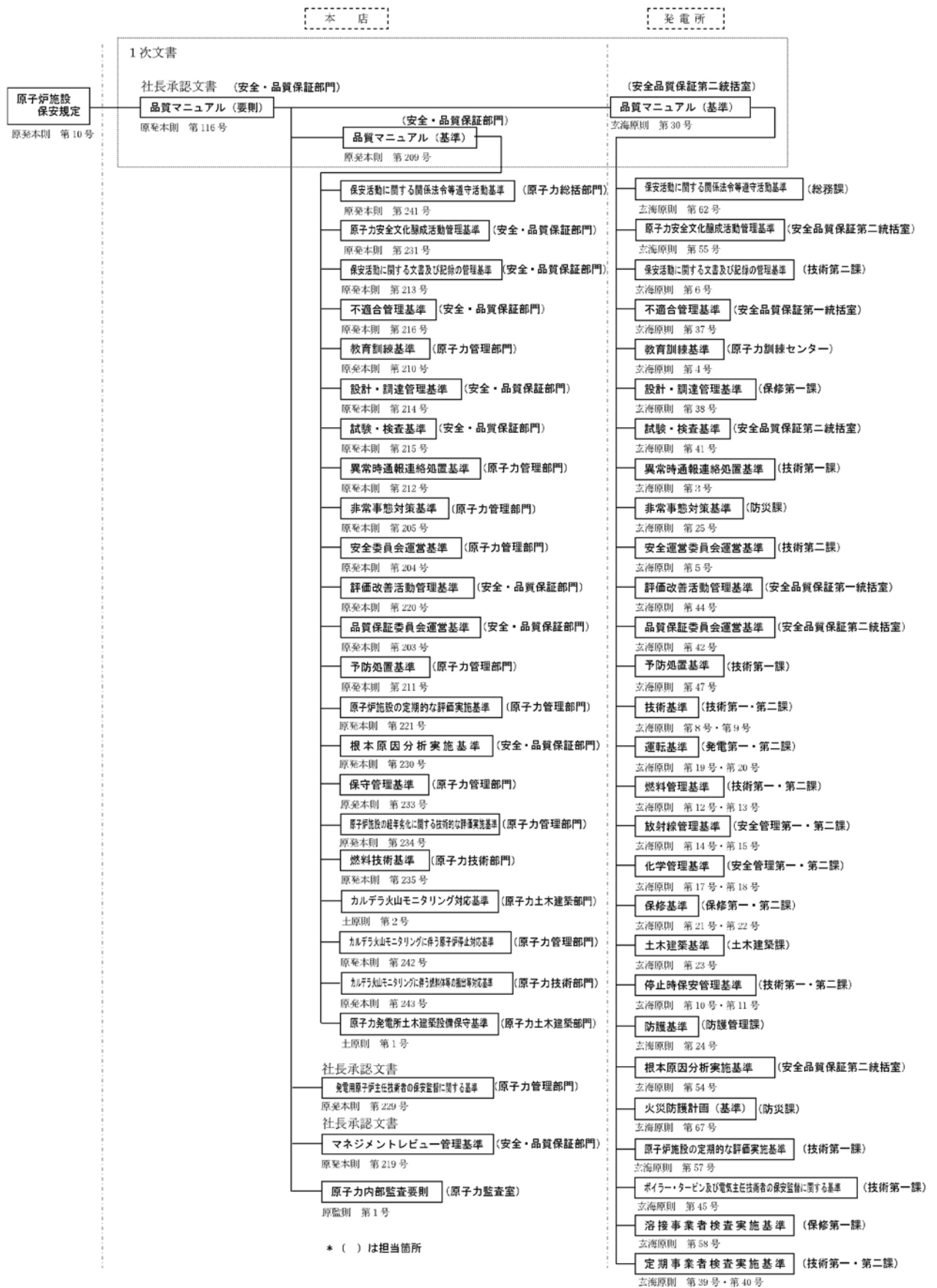
第1.17-1図 品質保証計画に係る規定文書体系図