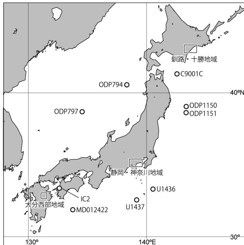
図1 調査地域及び本業務に関連した海底コア及び陸域コアの位置図