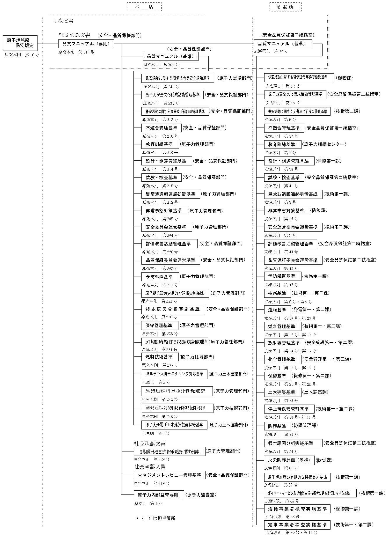
第1.17-1図 品質保証計画に係る規定文書体系図