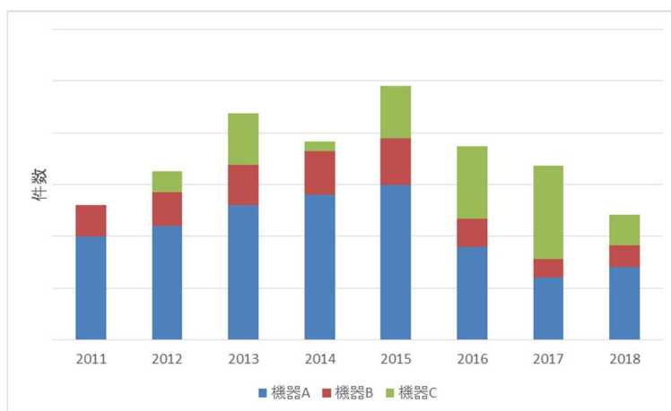
図1 作成する図のイメージ