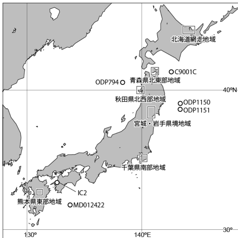
図 1 調査地域及び本業務に関連した海底コア及び陸域コアの位置図