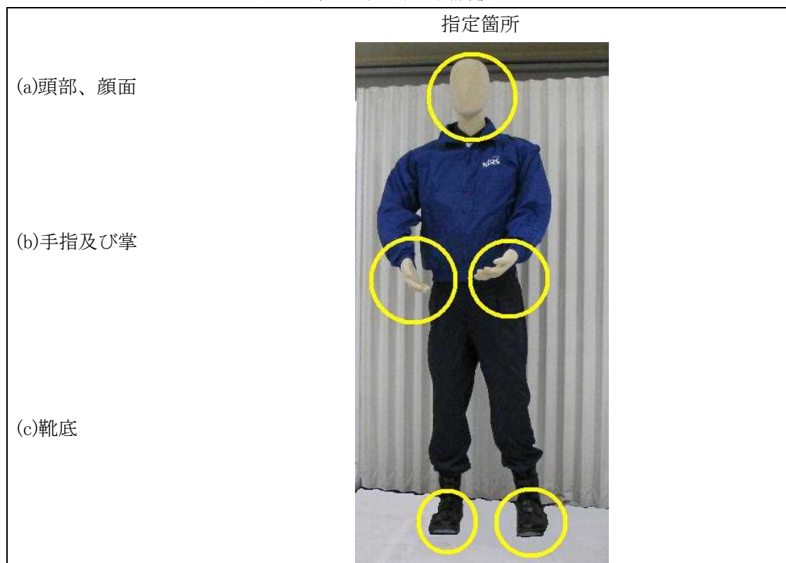
図4 住民等の指定箇所検査