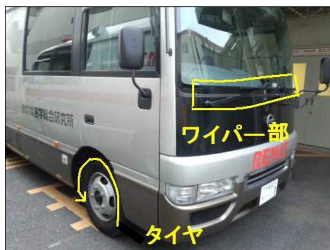
図3 車両の指定箇所